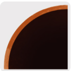
Tipo M Espesor de 0.63 a 0.78 mm