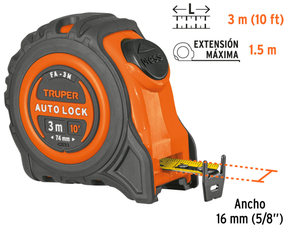
Cinta impresa por ambos lados