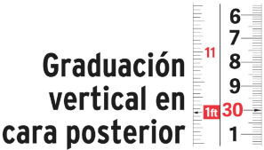
Graduación vertical en cara posterior