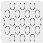
Malla al reverso