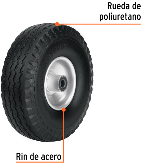
Para carros de carga