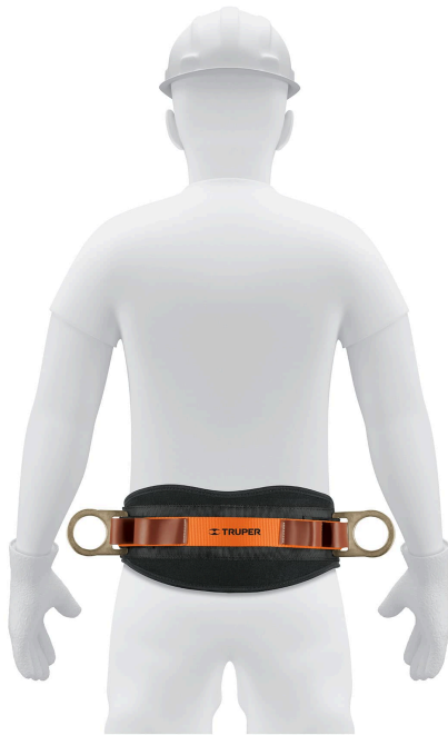
Cinta de poliéster ajustables con hebillas de acero forjado