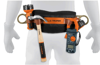
Compartimentos para herramientas