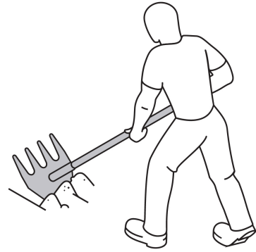
Azadón para remover tierra y rastrillo para jalar o empujar ramaje