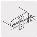
Clip para cinturón