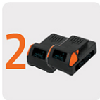
Incluye baterías ion litio