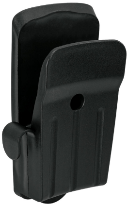
Incluye soporte para pared