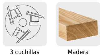
3 cuchillas Madera