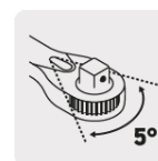
Mecanismo de 72 dientes