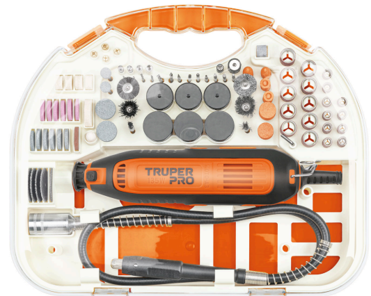
Incluye estuche organizador