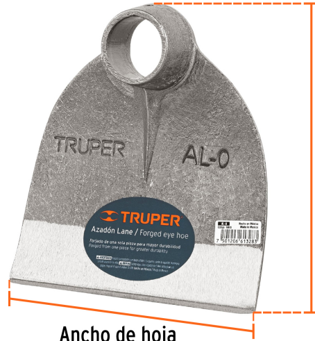
Altura de hoja 7" (18 cm)