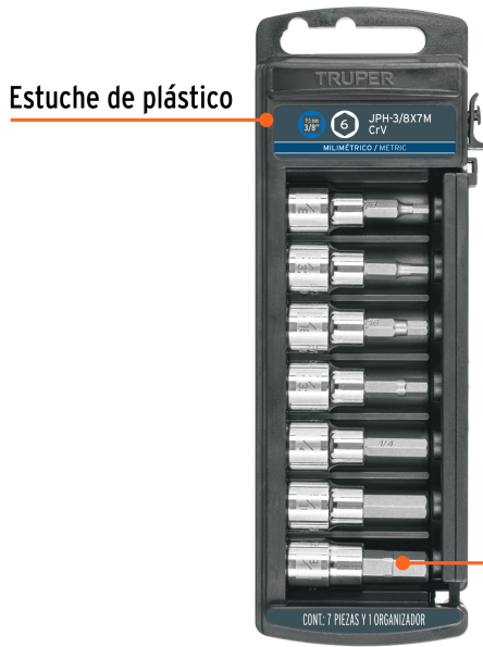
Estuche de plástico