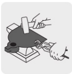
Forjado de una sola pieza