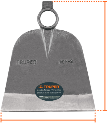
Altura de hoja 11" (28 cm)