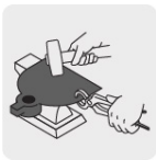
Forjado de una sola pieza