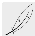
Pluma y plumón de ganso