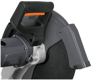
Mango en "D", más cómodo al trabajar en mesa