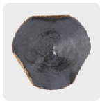
Zanco P3 antiderrapante