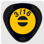
Marcado y código de color