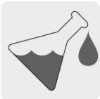
Resistente a ácidos