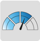
Uso recurrente Jardín residencial grande