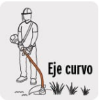
Eje curvo Para lugares de difícil acceso y mayor precisión