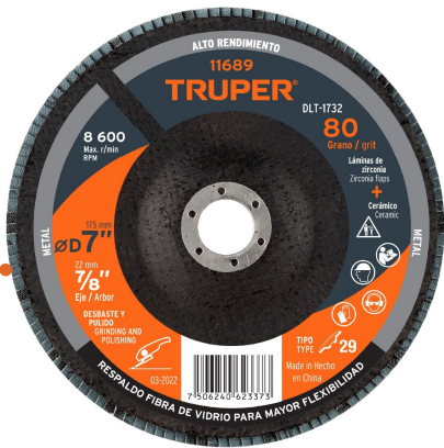
Las partículas generadas, no causan daño al sistema respiratorio