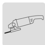
Para esmeriladora angular