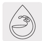
Para agua limpia