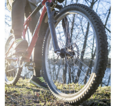
Llantas de bicicletas