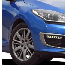
Llantas de automóviles