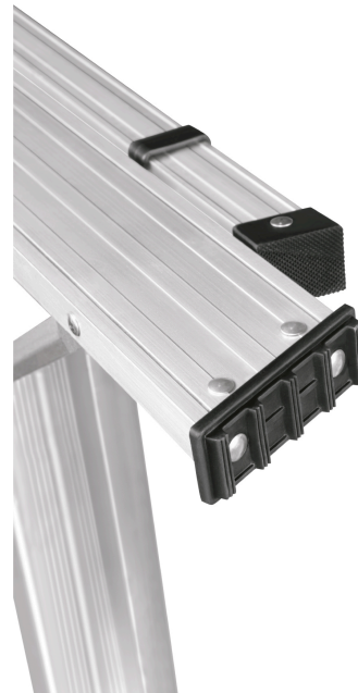
Tacones plásticos antiderrapantes