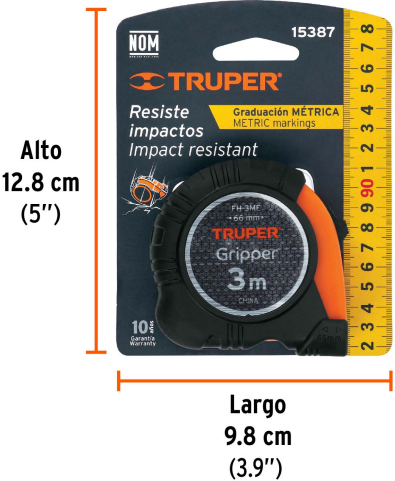
Peso: 0.14 kg (0.3 lb)