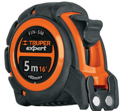
Gancho doble magnético