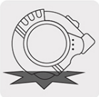
Resistente a impactos