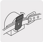
Clip de palanca para mejor sujeción