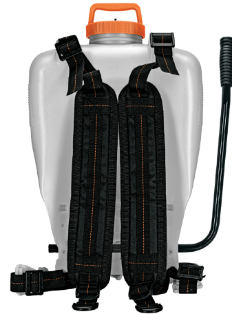
Correas ajustables y acolchadas para mayor comodidad