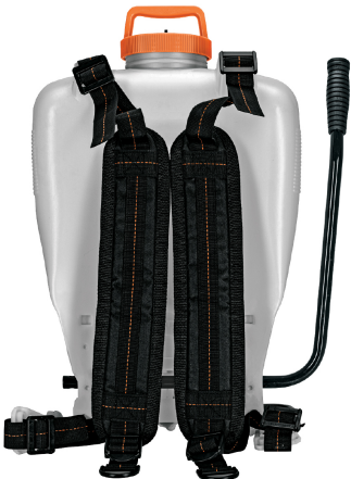
Correas ajustables y acojinadas para mayor comodidad