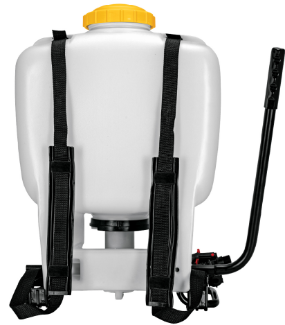
Correas ajustables para fácil transporte