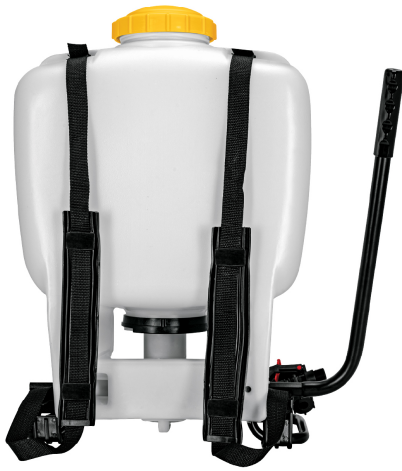
Correas ajustables para fácil transporte