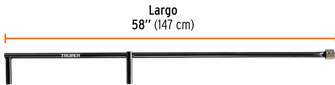
Largo 58" (147 cm)