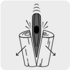
Para rajar leña y golpear otros materiales