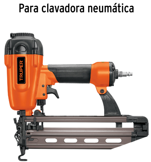
Para clavadora neumática