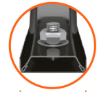
Soporte Calibre 15 (1.7 mm espesor)