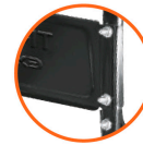
Puente Calibre 19 (1 mm espesor) Doble tornillo