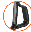
Nuevo tacón estabilizador con sujeción para descarga Calibre 15 (1.7 mm espesor)