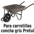
Para carretillas concha gris Pretul