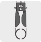
Apertura máxima 6" (150 mm)