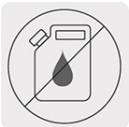
Libre de mantenimiento