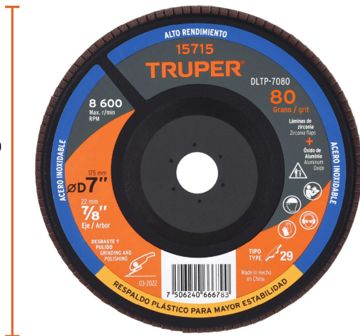
Diámetro interior 7/8"