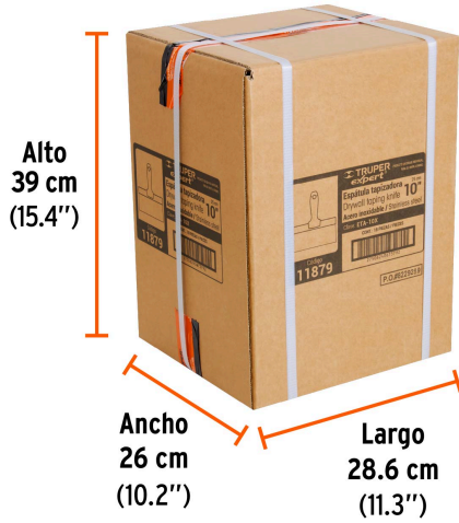
Alto 39 cm (15.4")