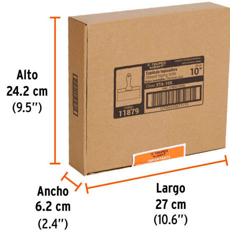
Alto 24.2 cm (9.5")