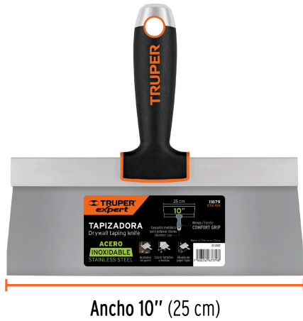
Ancho 10" (25 cm)