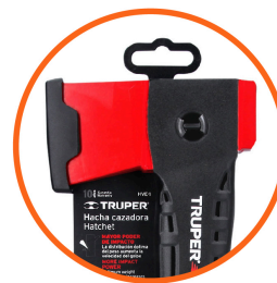
Funda plástica para fácil transporte y almacenamiento