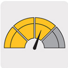
Nivel de limpieza PROFUNDA