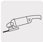
Para esmeriladora angular