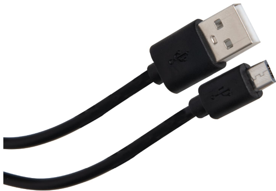
Incluye cable USB