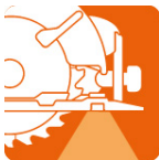
LED para iluminar