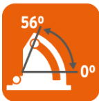
Capacidad de biselado