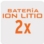
Más tiempo de vida Mayor velocidad de carga