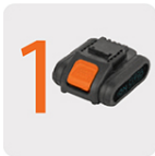
Incluye batería ion litio