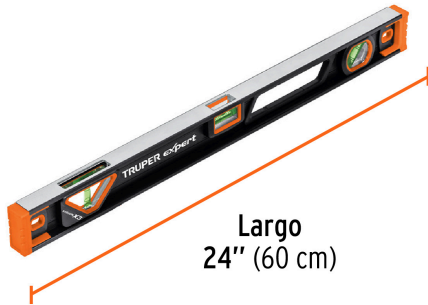
Largo 24" (60 cm)