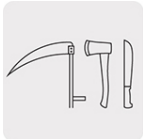
Para afilado y biselado