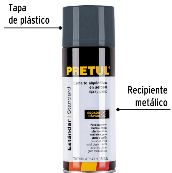
Tapa de plástico

Color aproximado. El tono puede variar de acuerdo a la superficie de aplicación